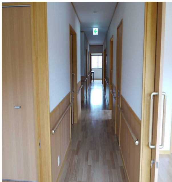
広々した手擦付の廊下