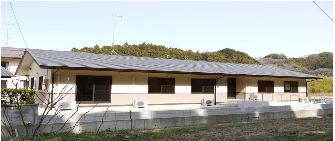
車いすも安心の玄関スロープ